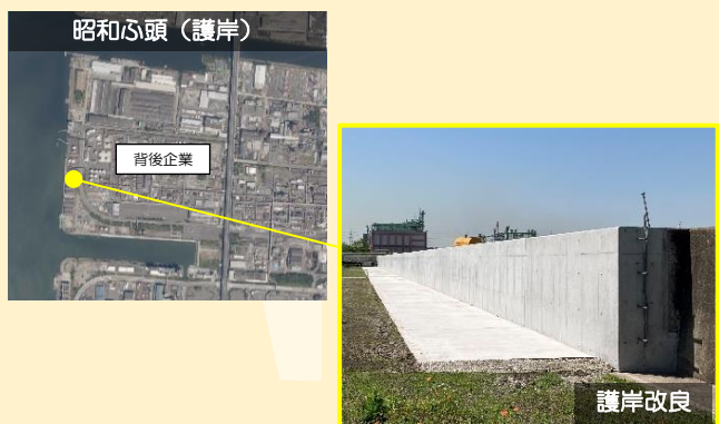
防潮壁の防災機能強化