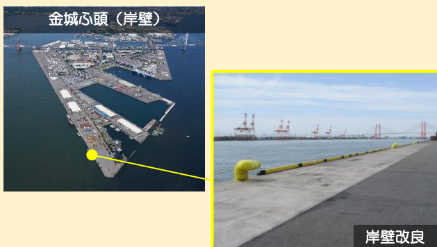
岸壁の老朽化対策